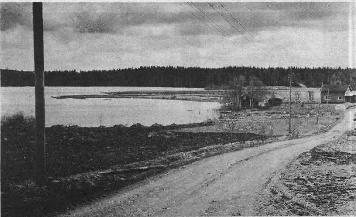
Näkymä lentonäytöksen katsomonttuun, pelto oli aidattu piikkilanka-aidalla ympäri. Kerrotaan, että järvellä on sattunut lento-onnettomuus aikaisemminkin, jo 100 vuotta ennen tätä 1930 sattunutta.